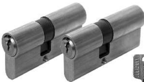
Rodzina 4 profili klucza