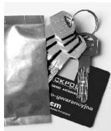
zabezpieczone klucze i karta kodowa

Wkładka dedykowana szczególnie dla pro-ducentów stolarki oraz salonów sprzedających drzwi, a także firm deweloperskich. Dzięki specjalnej konstrukcji finalny użytkownik ma gwarancję, że niepowołane osoby nie miały wcześniej dostępu do jego kluczy. Wkładka dostarczana jest z tzw. kluczem serwisowym wykonanym z mosiądzu oraz specjalnie zabezpieczonymi przed osobami niepowołanymi kluczami użytkownika. Montaż drzwi i wkładki odbywa się przy użyciu klucza serwisowego. Po wyjęciu z zaplombowanego opakowania kluczy użytkownika ich pierwsze użycie powoduje, że klucz serwisowy przestaje działać. Osoba która miała dostęp do klucza serwisowego nie ma już możliwości otwarcia drzwi.