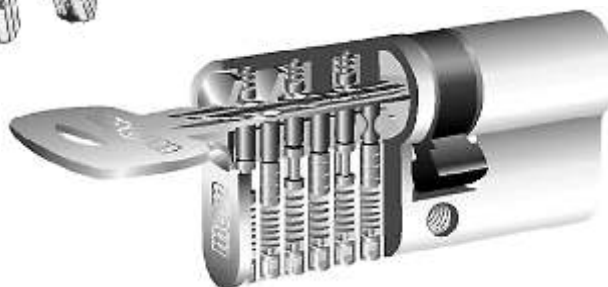
9 zapadek w 2 rzędach

Atestowana, cylindryczna, profilowa wkładka 9-cio zapadkowa (dwa rzędy zapadek). Innowacyjne zabezpieczenie przeciwprzewierceniowe, zabezpieczenie przeciwytrychowe, Zgł pat. Nr P.386954 z dnia 30.12.2008. Wkładki odporne na BUMPING. 5 kluczy w komplecie, i karta kodowa klucza. Wykończenie powierzchni: mosiądz i nikiel satynowy. Nikiel błyszczący dostępne opcjonalnie. Wkładki ASS STANDARD dostępne są także w kompletach tj. wkładka i wkładka z pokrętem. Certyfikat IMP ważny bez konieczności stosowania szyldów atestowanych klasa 62C